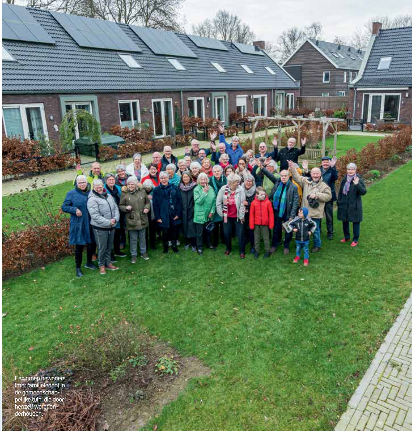
Een groep bewoners (met familieleden) in de gemeenschappelijke tuin, die door henzelf wordt onderhouden.

— 'Nederland vergrijsd harder dan de zeespiegel stijgt'