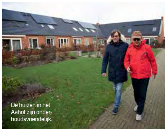
De huizen in het Aahof zijn onderhoudsvriendelijk.