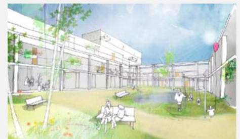
In de stad een hofje met meerdere bouwlagen.